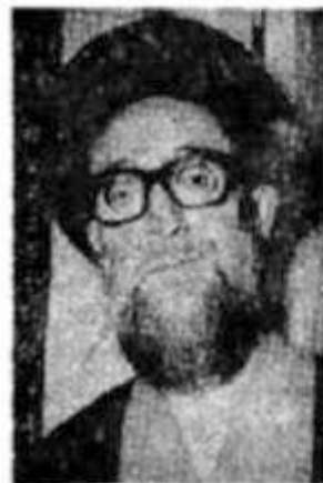
آیت الله قاضی طباطبائی

ترور آیت الله قاضی آذربایجان را به سوء قصد به جان نماینده آیت الله العظمی