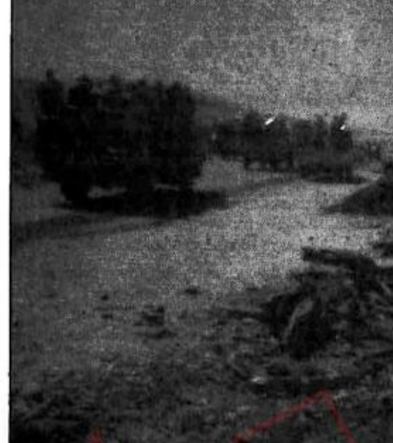
مناقصین در ستونی همراه با بیش از هزار خودروی نظامی دست به این تحرک زده بودند که عمده آنها در همان شب اول با آتش آری بی جی و بمبارانهای هوایی، هلی کوپتر و...

مستقیم و مشکل است پستان باوریم. بعد یک کندی گفت که زیاد هم تکرار میکردند و معنی اش این بود که او را ازین ببرید. یعنی مستور دادند که فرمانده خودشان توسط خودشان ازین برود که مبادا به دست ما بیفتند.