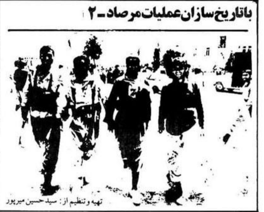
تهیه و تنظیم از: سید حسین میرپور