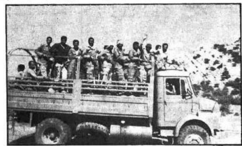
حضور شادمانه اقاتار مختلف مردم توانست منطقه را به گورستانی برای مزدوران استکبار تبدیل کند

لحظه‌ای که نلکس خیری در پیروی از ۳۰ متره ۳ خطی با یک لطفه جالبی است. وقتی منافقین و منافقات با بیگانه‌ها در کنار هم می‌ایستند، سراسر مشغول به صحبت‌های بی‌مورد و بی‌فایده می‌شوند. در این هنگام، آن‌ها در پی یافتن کلماتی هستند که بتواند به آنها اعتبار بخشد.